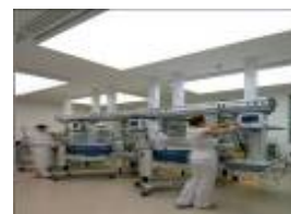
Südtiroler Sanitätsbetrieb Azienda Sanitaria dell'Alto Adige Azienda Sanitaria de Sudtirolo